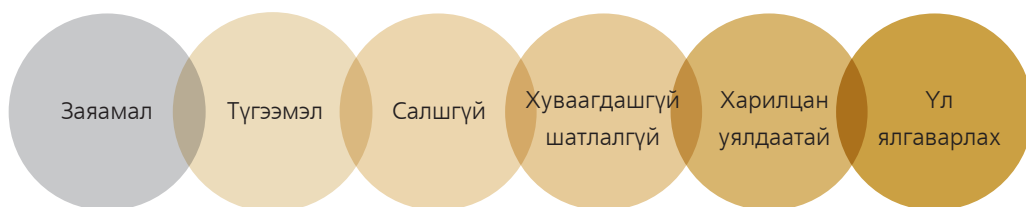
Зураг 1. Хүний эрхийн суурь зарчмууд

Заяамал : Хүний эрх нь төрөлх, заяамал шинжтэй. Бүх хүн нас, хүйс, яс үндэс, гарал үүсэл, арьсны өнгө, бэлгийн чиг баримжаа, хүйсийн илэрхийлэл, хэл, шашин шүтлэг, боломж чадвар, нийгэмд эзлэх байр суурь, иргэний харъяалал болон улс төрийн үзэл бодол зэргээс үл хамааран ижил хүндлэл хүлээнэ.